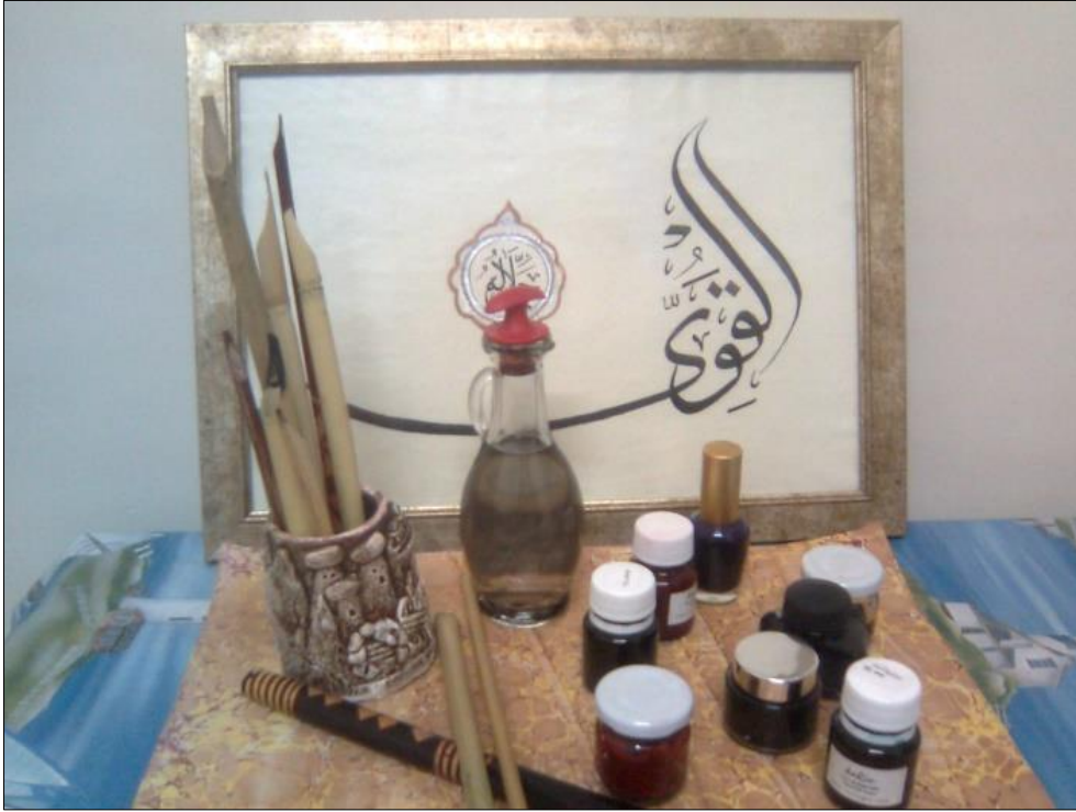
Şekil 5 Mürekkebin Hazırlanmasında Kullanılan Malzemeler

(Yazır, 1989). 17. yüzyıla ait bir eser olan “Gülzâr-ı Savab” kağıt boyama, ahar, mürekkep yapımı gibi konularda günümüz sanatçı ve restoratörleri için kaynak bir kitaptır. Eserde tarifi verilen pek çok farklı malzeme ve yöntemden seçilen birkaçı İstanbul Üniversitesi Edebiyat Fakültesi Taşınabilir Kültür Varlıklarını Koruma ve Onarım Bölümü Kağıt Konservasyon Laboratuvarı’nda uygulanmıştır.