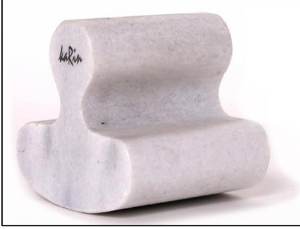
Şekil 3 Destiseng