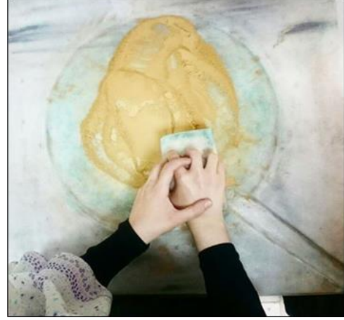
Şekil 4 Boyanın Ezilmesi

Geleneksel Türk Ebrusunda Kullanılan Renkler (Derman,1977):