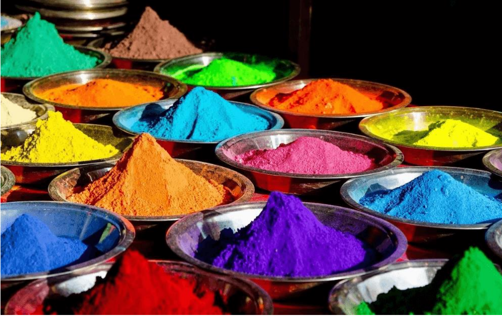
Şekil 1 Çeşitli Renlerde Doğal Boya

Bütün bunlardan edindiğimiz sonuç, tezhipte kullanılan motifler ve renkler rast gele seçilmemiş hepsinin birer sembolik anlamı olduğu gibi bilinçli olarak seçilerek kullanılmıştır. Türk sanatkarı tabiatın gözlemlediğini, hissettiğini, duygularını, inançları değer yargıları ve yaşadığı çevrenin kendinde bıraktığı izleri toplayarak, hissederek sanat eserinde mesajlar vermek istemiştir. Burada da her dönemde kendine has karakterini bir ekol olarak meydana getirmiştir (Derman, 2007). Tezhip sanatında renklerin seçimi devirlere göre değişir. Selçuklu sanatçıları kullandıkları motifler ve renklerde bir ibadet vecdi duymuşlar, Kur'an'ı tezhip ederken aynı duyguları yaşatmışlardır. Desenlerle verilmeye çalışılan sonsuzluk etkisi, renklerde destekleyici bir anlamda tamamlanmaktadır. Altın baş eleman olarak güneşi sembolize ederken, ışığın rengi olan