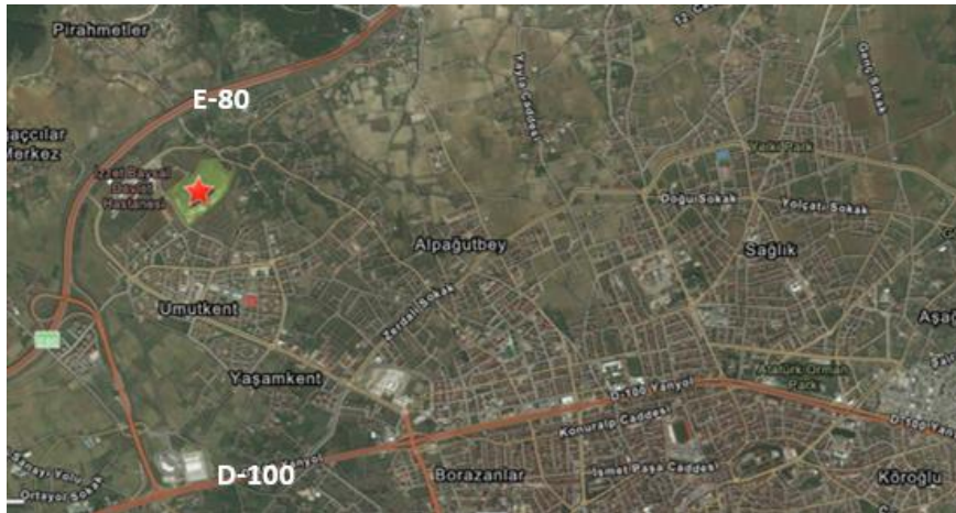
Resim 5. Koroğlu Parkı ve Koroğlu heykeli

merkezi ile bağlantının yeni yapılandırılan bisiklet yolları ile desteklenmesi, erişilebilirlik ve yayalaştırma politikaları açısından doğru bir yaklaşımdır. Kentin içi arazi kullanımında yeşil alanların m 2 sine katkıda bulunacak park, kent morfolojisinde olumlu bir işleve sahiptir. Kentin kuzeyinde, E-80 karayolunun güneyinde yer alan ve halen yapımı süren Uluslararası Koroğlu Parkı Projesi bu çalışma kapsamında incelenmiştir. Bu park projesinde bulunan Koroğlu heykeli ve peyzaj tasarımında, Koroğlu Destanını sahiplenen Türk Cumhuriyeti ülkelerinin, kendilerine ait Koroğlu karakterlerinin yer aldığı bir platform mevcuttur. Ayrıca park genelinde Türk Cumhuriyetlerinin farklı bahçe yorumlarının bulunması, Türk kültürünü oluşturan ortak değerlerin bu destanın uluslararası bir boyut taşıdığını göstermektedir. Bununla birlikte kullanım alanlarının arasında bulunan at gezinti yolları da hikayenin epik yanını ortaya çıkarmakta aynı zamanda kullanıcıyı destana dahil etmektedir. Park geneline sahip olan topoğrafya ve karakterin heykellerine ulaşımda kullanılan basamaklar, hikayedeki coğrafya ve topoğrafyanın strüktürel soyut formu olarak algılanmaktadır. Fakat destana ait diğer karakterler projede işlenmemiştir.