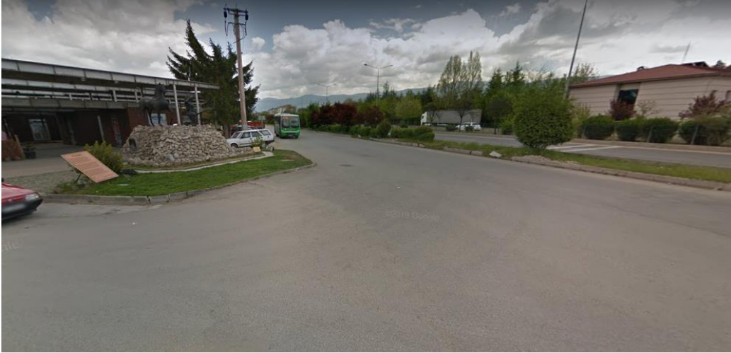
Resim 4. Köroğlu Heykeli ve Çeşmesi

Tüm heykel strüktürleri kent içinde bağımsız, destanın kullanıcı tarafından algılanması, okunması kapsamında bilgilendirme ve eksik anlatı ile tanımsızdır. Kent genelinde Köroğlu strüktürlerine bakıldığında karar vericilerin, yerleştirme tercihlerinde yalnızca reklam ve pazarlama stratejisi bakış açısı ile konuya yaklaştıkları açıkça fark edilmektedir. Mekan üzerindeki işlevsel, deneyimsel, anlamsal görevleri ve estetik, kültürel, bilgilendirme değeri unutulmuş bu sanatsal ve plastik objeler, refüjlerde,